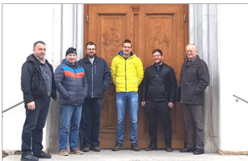
Delovni obisk in ogled orgel v Zagorju ob Savi.